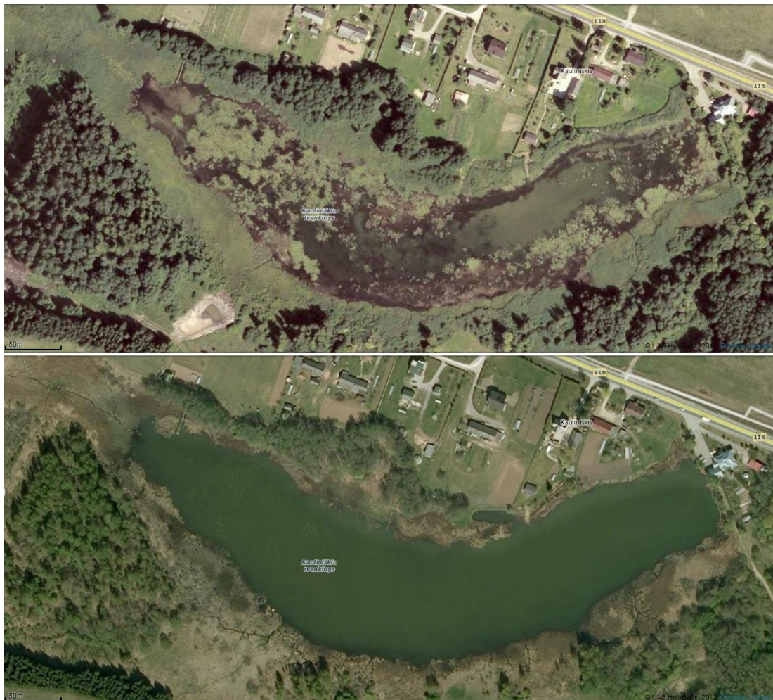
2 pav. Kauliniškio tvenkinys orto-foto nuotraukoje 2014 (viršuje) ir 2010 (apačioje)

tvenkinio plote gausi povandeninė, pakraščiuose ir seklumose – plūduriuojanti ir povandeninė augalija (plūdenos, lūgnės, lelijos ir kt.). Vasaros metu paviršinė vandens augalija dengia iki 40% vandens paviršiaus ploto. Pastebima ryški telkinio eutrofikacija dėl galimos biologinės taršos iš aplink esančių gyvenviečių. Tai akivaizdžiai matoma iš 2010 ir 2014 metais darytų orto-foto nuotraukų (2 pav.).